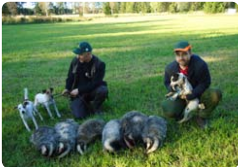
Resultatet minus räven.