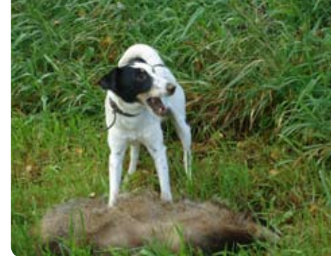
Hugge på morgonhumör.

Efter lite vila och sömn gjorde vi oss fär-