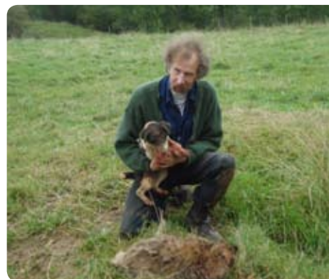
Nöjd husse och hund.