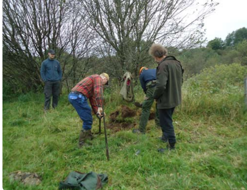
Gräjsa har ståndat i 15 minuter.

Ett sista gryt hann vi med och tog Ayla som direkt fick kontakt med bara 20 cm ner till grävlingen expedierade vi denna mycket snabbt. Vi var alla nöjda med dagen och tre grävlingar med olika hundar och arbetssätt.