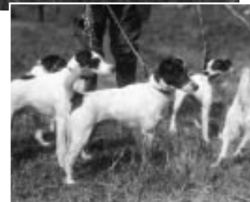
Bilden ovan: Släthårig foxterrier anno 1914!